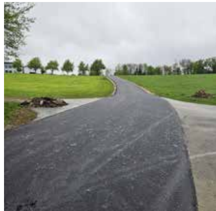
Sanierung Straße Steinpoint