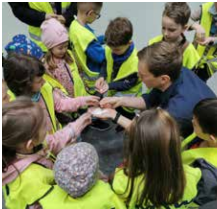
Kindergarten besucht die Fa. MKW