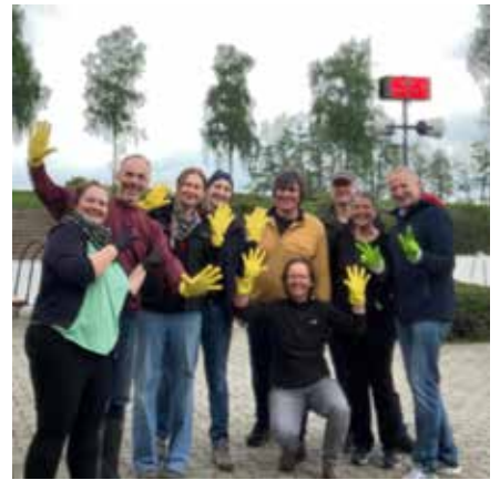
Schwimmverein - Reinigung