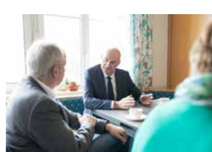
Sozialzentrum LR Dörfel