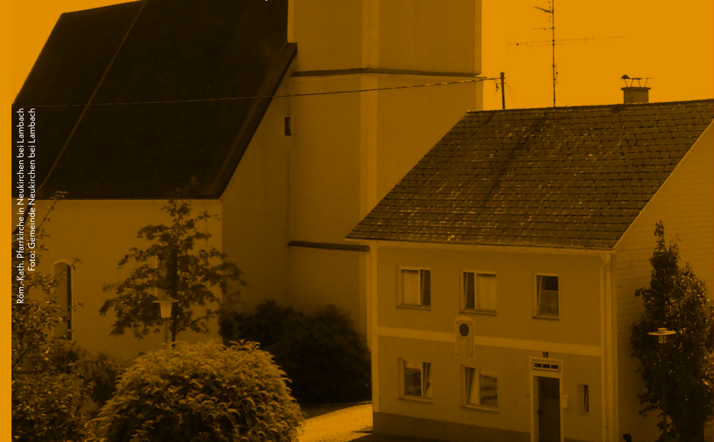
Röm.-Kath. Pfarrkirche in Neukirchen bei Lambach